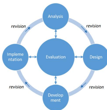
Gambar 1 ADDIE

Penelitian ini menggunakan model pengembangan ADDIE ( Analysis, Design, Development, Implementation, and Evaluation ). Model pengembangan ADDIE yang digunakan dapat digambarkan dalam diagram di bawah ini (Branch,2009:2)