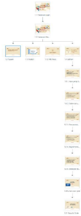
Gambar 3 Alur Kerja

Tahap pengembangan produk merupakan tahapan selanjutnya dari desain sistem. Pada bagian ini rancangan yang telah disusun sebelumnya akan dibuat. Elemen yang dibuat merupakan gabungan antara desain grafis, bahan materi pembelajaran, serta audio pendukung.