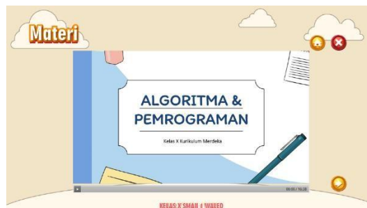
Gambar 8 Halaman Materi

Dalam tahap validasi desain pembelajaran, terdapat dua jenis validasi yang dilakukan, yaitu validasi oleh ahli dalam bidang media dan validasi oleh ahli dalam bidang materi. Setelah melalui proses validasi oleh validator yang ahli dalam bidang media dan validator yang ahli dalam bidang materi, media pembelajaran berbasis Web telah siap untuk diuji coba. Uji coba ini melibatkan ahli media dan ahli materi. Untuk mengetahui tanggapan kedua ahli terhadap media pembelajaran interaktif Web mengenai materi Algoritma dan Pemrograman sosial infomatika.