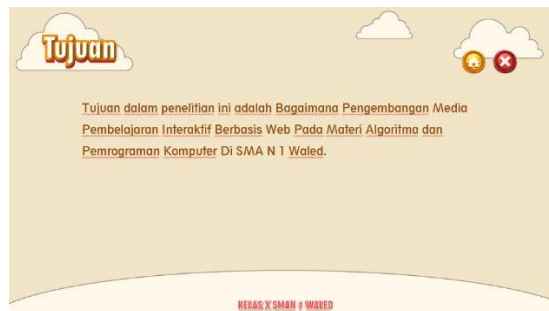
Gambar 6 Halaman Tujuan