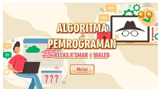
Gambar 4 Implementasi Desain Awal Sistem

Tahap pengembangan produk merupakan tahapan selanjutnya dari desain sistem. Pada bagian ini rancangan yang telah disusun sebelumnya akan dibuat. Elemen yang dibuat merupakan gabungan antara desain grafis, bahan materi pembelajaran, serta audio pendukung.