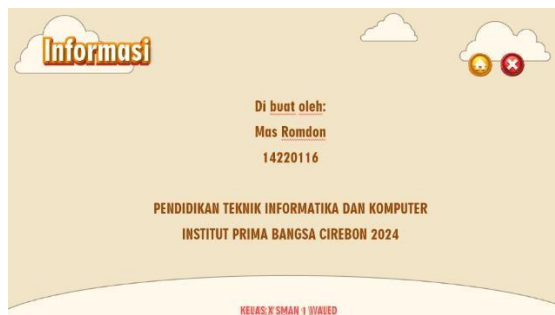
Gambar 7 Halaman Informasi